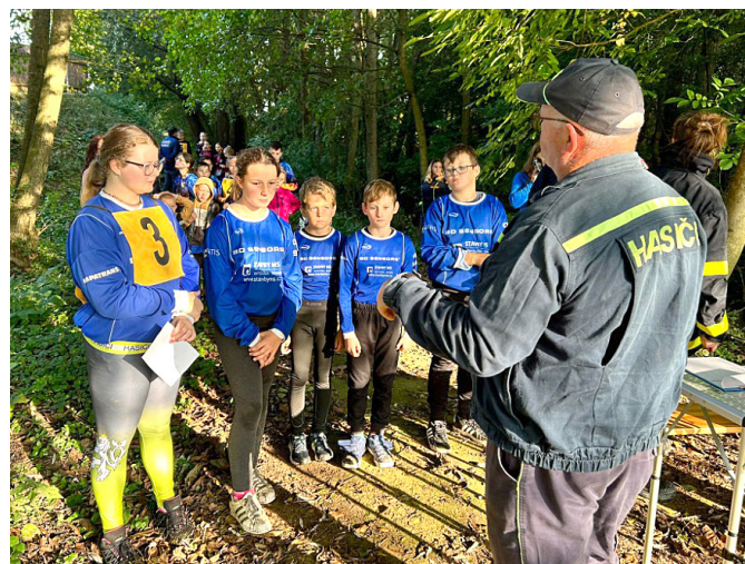
Závod hasičské všestrannosti a brannosti