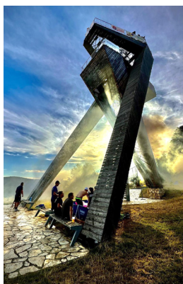
Rozhledna podvečer po závodech