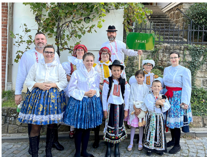
Slovácké slavnosti Uherském Hradišti