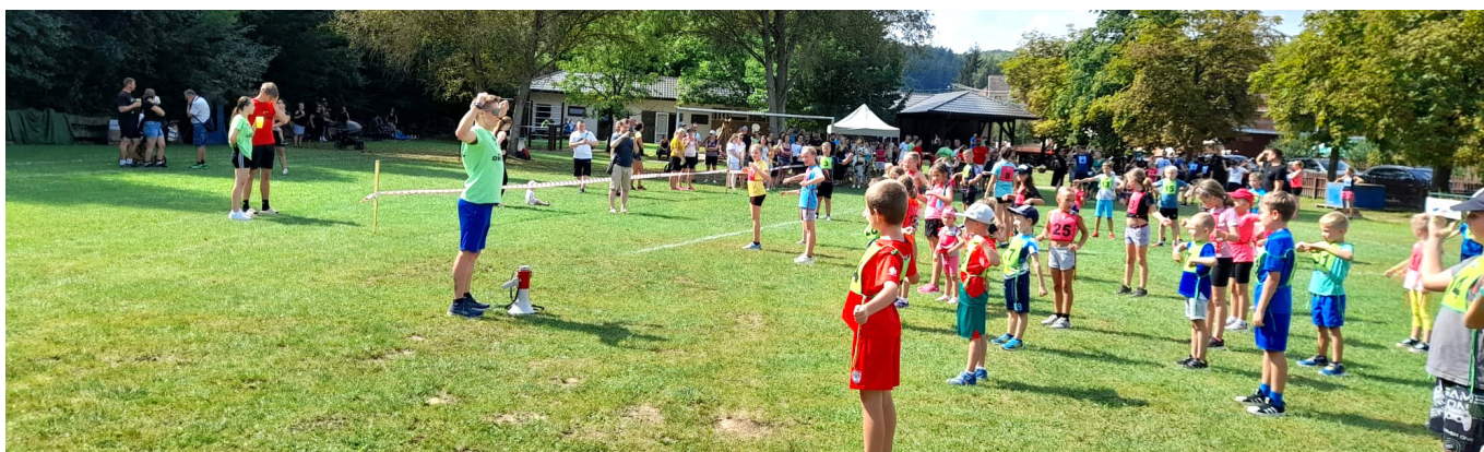
Atletika - rozcvička před závodem