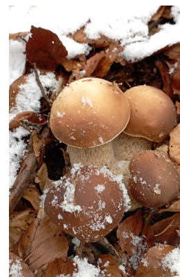
Nadílka na Salaši