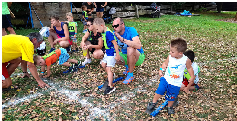
Budoucí atleti před startem