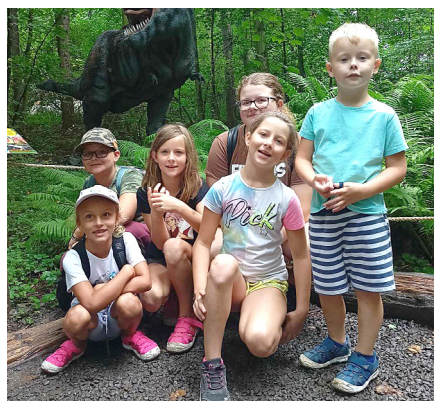
Výlet malých hasičů